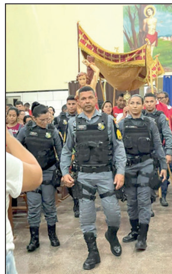
Policiais conduzindo o padroeiro