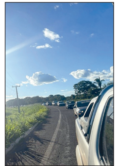
Carreata trazendo a Relíquia do Padroeiro