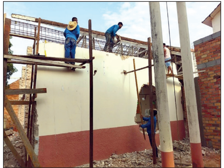
Reforma e ampliação da Matriz.

Momento esperado por todos foi a chegada da Relíquia de São Sebastião, trazida pelo Corpo de Bombeiros, Militares, esta, ficará exposta no altar da Matriz quando for reaberta e dedicada pelo senhor Bispo Diocesano.