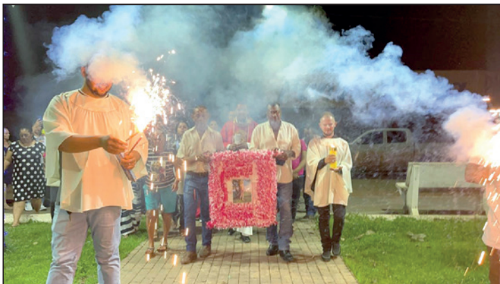
Folia São Sebastião.

Entre os dias 01 a 22 de Janeiro de 2023, fizemos os festejos do nosso Padroeiro Glorioso Mártir São Sebastião. Houve Celebrações de Santas Missas, batizados, novenas nas fazendas e na área urbana da cidade. Também apresentação da Folia de São Sebastião, Banda de Música do estado de Goiás, shows com artistas locais.