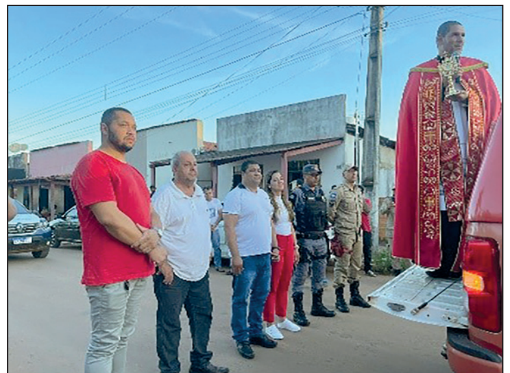
Autoridades Municipais recebendo a Reliquia na Prefeitura Municipal.

Foi um momento da Graça de Deus e de muita espiritualidade e emoção, vivenciado pela comunidade.